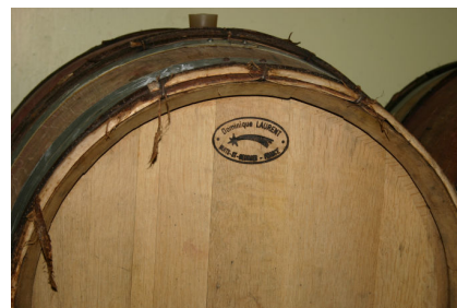
ドミニク ローランの樽 より繊細になるそうです