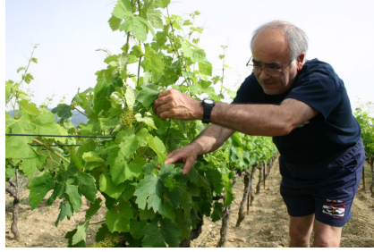
畑にて樹の状態をチェック