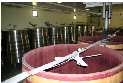
中に冷却装置のついた木製の発酵槽 後には上部がすぼまったステンレスタンク