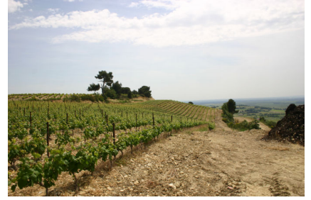
石がごろごろと混じっています