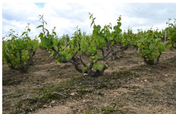
セラーのすぐ隣にあるゴブレ仕立てのガメイ