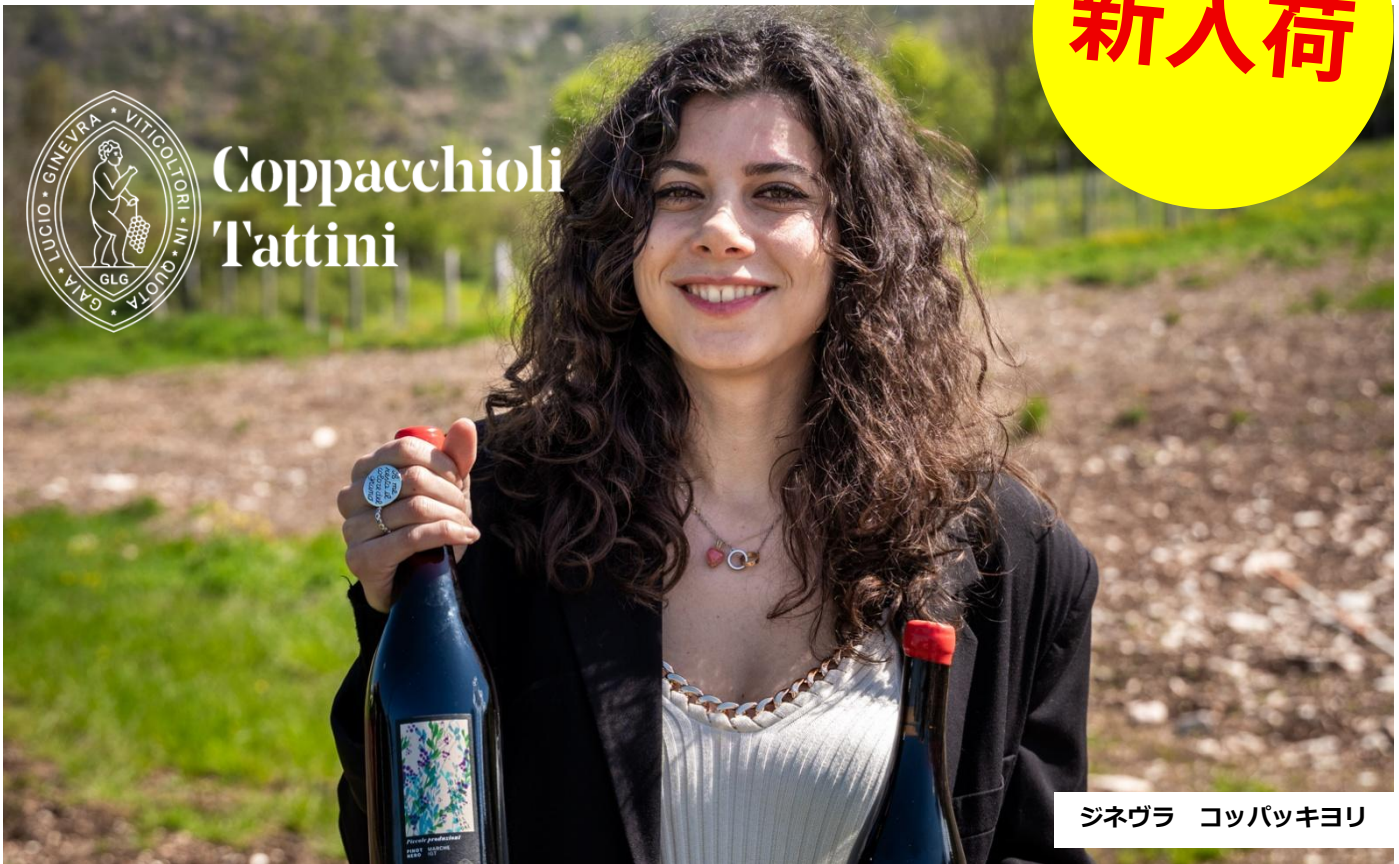
ジネヴラ コッパッキヨリ

標高 1,000m の高地で育つ古代品種“ヴィッサネッロ”に注目！ マルケ州の若手生産者による個性的なワインが新入荷しました！